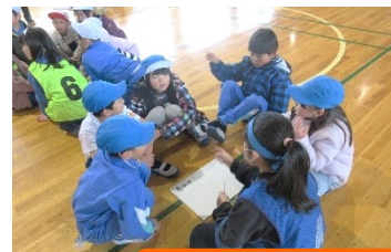
冬となかよし集会

冬となかよし集会では、3年生が中心となってゲームを進めました。赤・白・青団ごとにドッジボールやジェスチャーゲーム、クイズラリーを通して交流することができ、楽しい集会となりました。