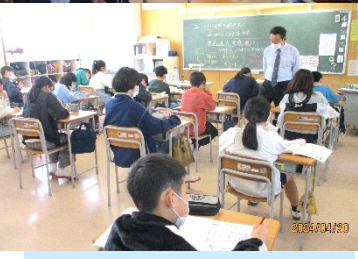
6年 家庭 見つめてみよう 生活時間

学習参観 4月20日(土) 子供たちは緊張しながらも、がんばっている様子を見てもらおうと張り切りました。