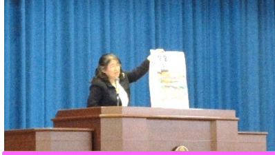
4月5日 始業式 新しい担任の先生との出会いにドキドキしていました。