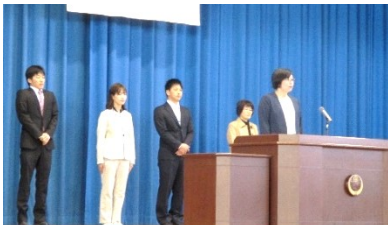
4月5日 着任式 5名の新しい教職員を迎えました。これからよろしくお願いします。