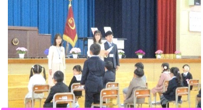
4月8日 入学式 新入生20名を迎えました。全校146名でなかよくしていきましょう