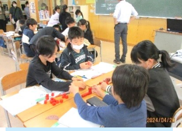
5年 算数 直方体や立方体の体積