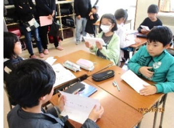
4年 国語 力を合わせてばらばらに