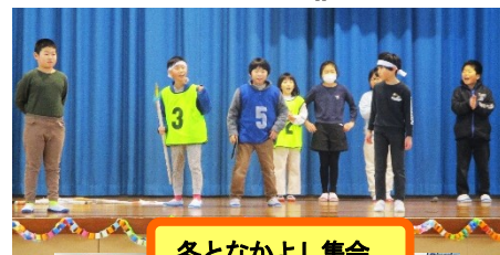
冬となかよし集会

集会では、3年生が中心となってゲームを進めました。赤・白・青団ごとに「猛獣狩りに行こう」のゲーム等を通して交流することができ、楽しい集会となりました。