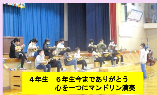
4年生 6年生今までありがとう 心をついにマンドリン演奏