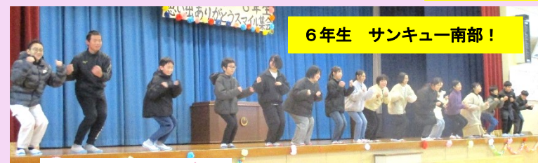
6年生 サンキュー南部！

「最高のリーダー6年生 思い出ありがとうスマイル集会」を開催しました。5年生が中心となり、集会の企画・運営を行いました。今までお世話になった6年生に感謝とお祝いの気持ちを表そうと、練習してきた出し物を披露したり、プレゼントを渡したりしました。最後に、集会にご招待した安全パトロール隊長へ6年生児童代表がお礼の言葉を述べました。