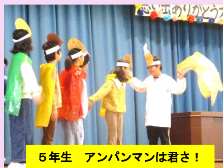
5年生 アンパンマンは君さ！