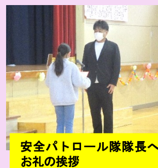
安全パトロール隊長へ お礼の挨拶