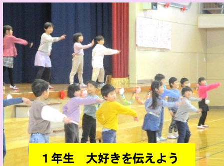
1年生 大好きを伝えよう