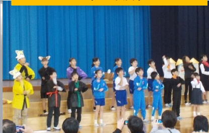
4年 劇 ごんぎつね、帰り道の途中で 4年生と出会う