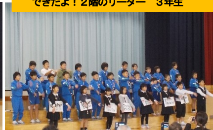
3年 表現活動 できたよ！2階のリーダー 3年生