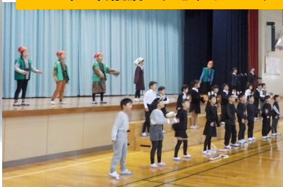
1年 音読劇 おむすびころり