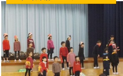
2年 音楽劇 スイミー